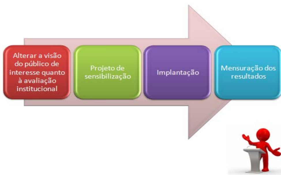
Figura 1 – Etapas a serem seguidas pela CPA no processo de auto avaliação institucional

Apresenta-se na figura 1 as etapas seguidas pela CPA, elas ilustram os “caminhos” que a avaliação institucional percorre no âmbito da IES.